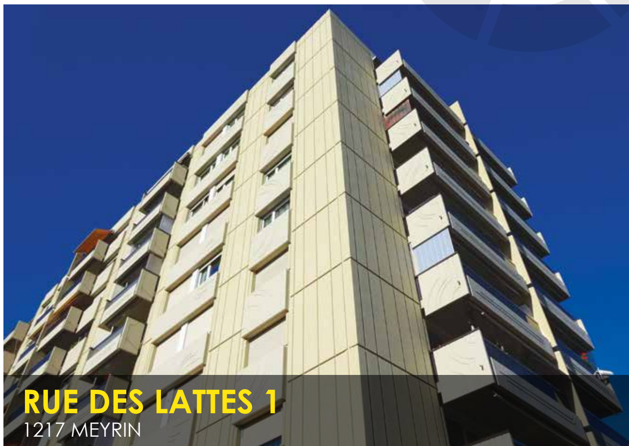
RUE DES LATTES 1 1217 MEYRIN

Maître de l'Ouvrage : Université de Genève